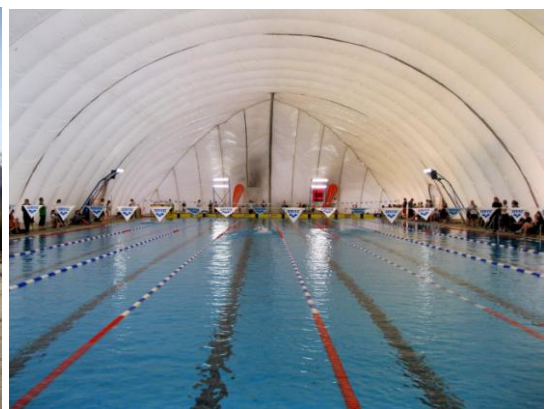
Traglufthalle Schwimmbad Mainzer Schwimmverein gGmbH