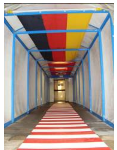
Tragfluthalle Schwimmbad Mainzer Schwimmverein gGmbH